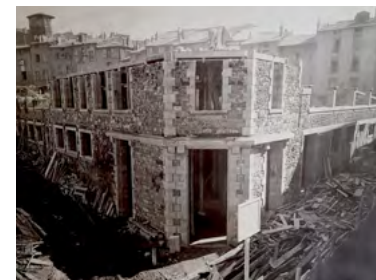
Construction de l'école Jeanne d'Arc - Le Puy-en-Velay