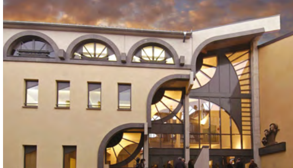
Ateliers des Arts