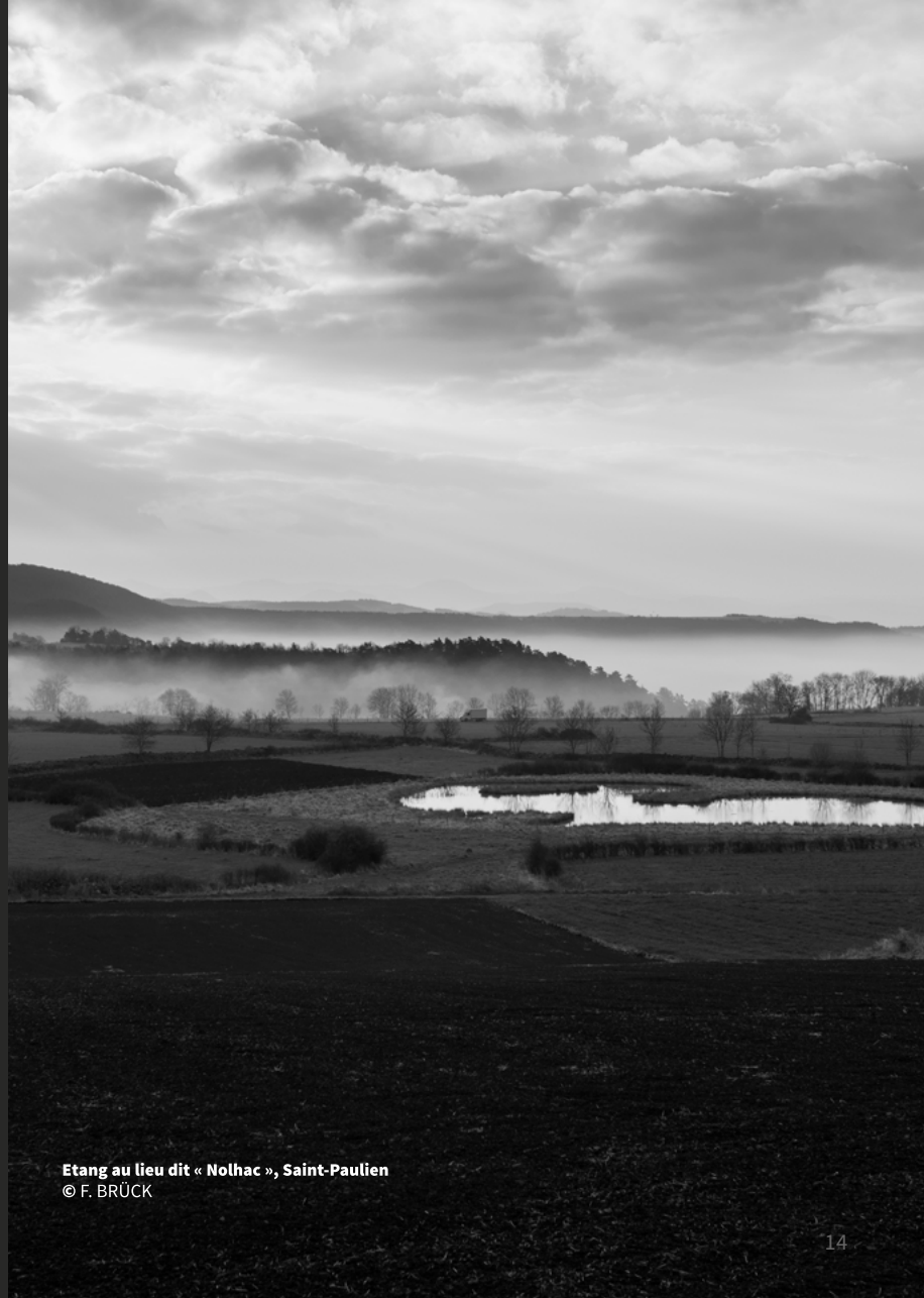
Etang au lieu dit « Nolhac », Saint-Paulien

d'après DES SIGNES studio Muchir Descloids 2015