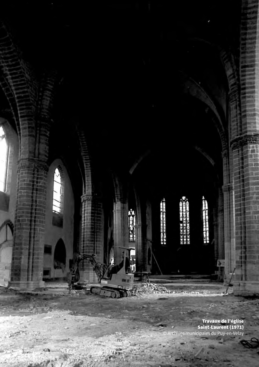
Travaux de l'église Saint-Laurent (1971)